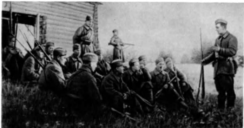
Политбеседа с бойцами