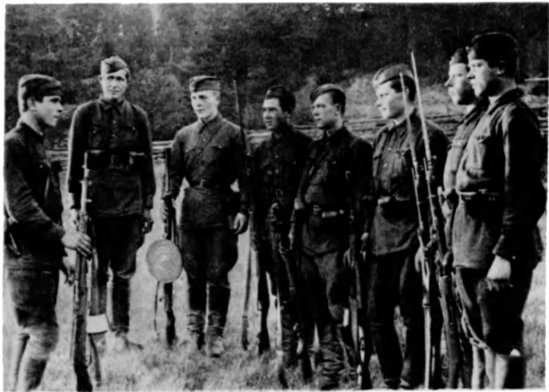
Постановка боевой задачи