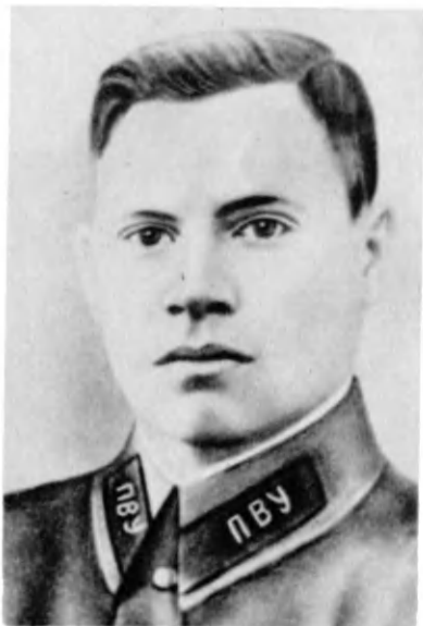
Н. С. Мясищев