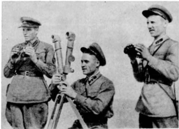
Учения накануне войны